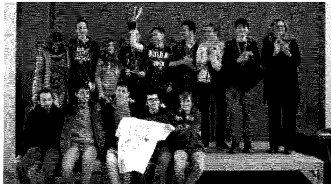
Il gruppo di studenti del Leonardo che ha vinto la Disfida matematica

Gli studenti hanno dovuto risolvere 24 problemi logici (più uno «jolly») ambientati tra gli chef di una cucina